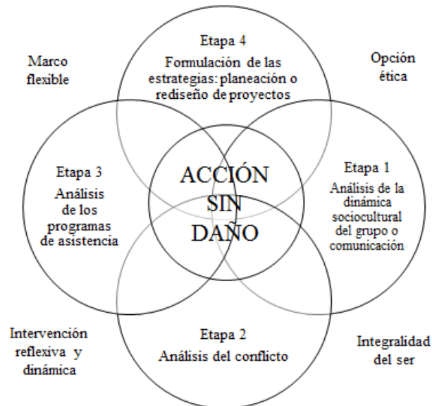
Grafica 2. Esquema metodología Acción Sin Daño

Fuente: Tomado de (Universidad Nacional de Colombia, et al , 2011, p. 22)