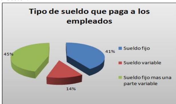
Gráfica 2. Tipos de sueldo pagado a los empleados en el sector.

Teniendo en cuenta los resultados obtenidos en la gráfica 1 de la aplicación del censo se pudo evidenciar con esta primera pregunta que el principal foco de comercio en el sector de estudio concierne a los alimentos, sumando sus dos mayores exponentes el 52% (Restaurante-Comidas Rápidas y Supermercado –Tienda), mientras que minoristas como las papelerías (18%), salas de belleza (14%) y droguerías (10%) se encuentran en segunda línea pero con participación conjunta muy fuerte (42%). Teniendo en cuenta que el censo de población nos dio un total de 95 establecimientos de comercio en dicho sector.