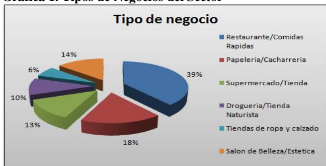
Gráfica 1. Tipos de Negocios del Sector